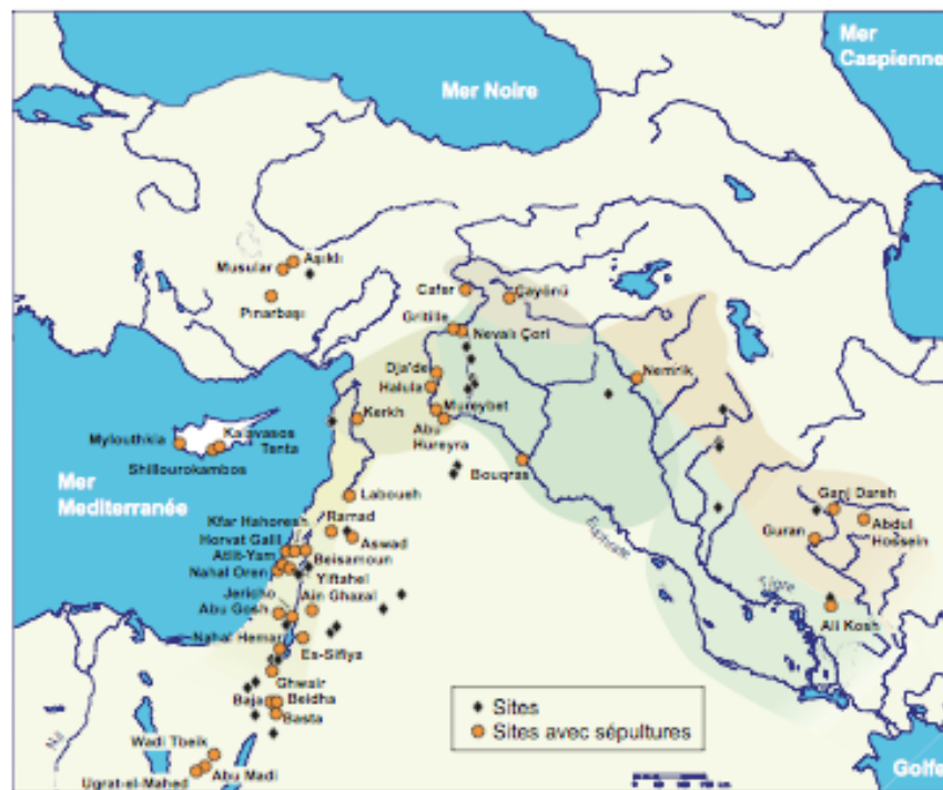
Fig. 2 : Les principaux sites avec sépultures (8700-7000 av. J.-C.).

le regroupement des défunts dans des bâtiments à usage funéraire, le dépôt de restes humains dans des puits, l'association d'animaux ou de parties d'animaux aux vestiges humains, l'utilisation de nattes dans les sépultures, le traitement spécifique de certains crânes apparaissent dans certaines régions.