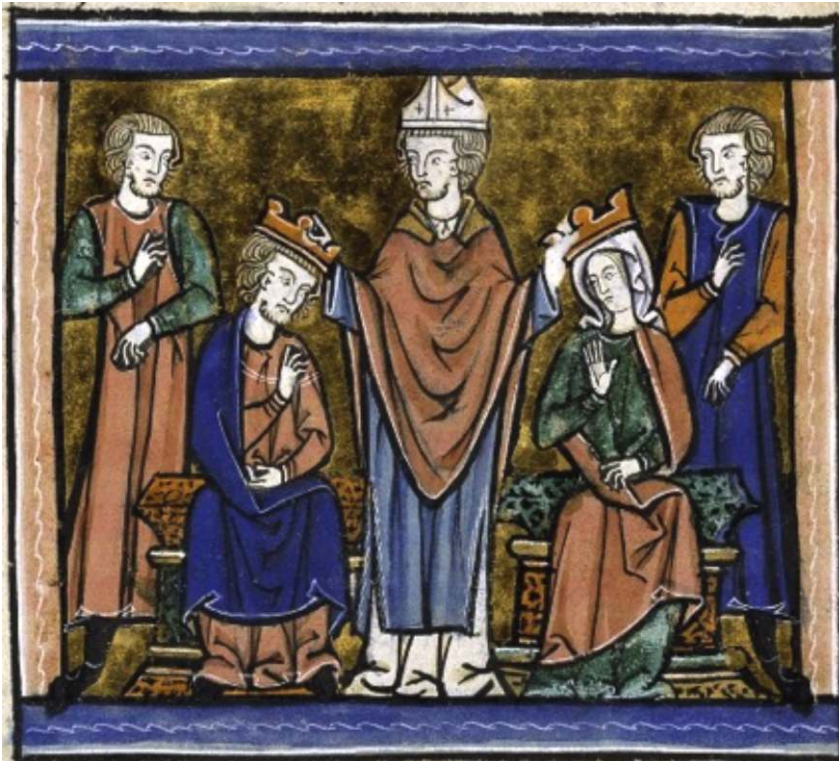
Couronnement de Foulque et de Mélisende (Guillaume de Tyr, Historia , BNF ms. FR 779 fol. 123v)