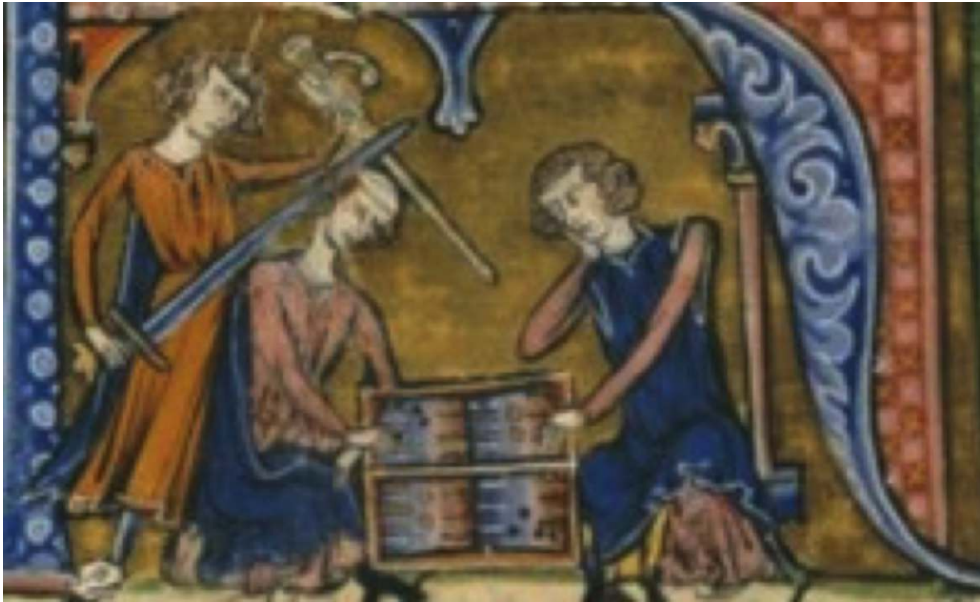
Attentat contre Hugues du Puiset (Guillaume de Tyr, Historia , BNF ms. FR 9081 fol. 160)