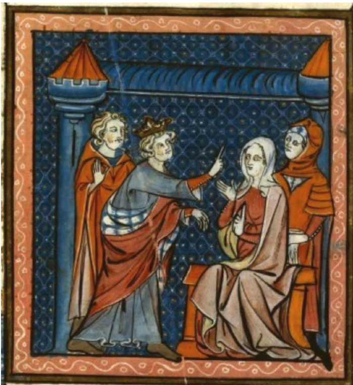
Baudouin III sermonnant Mélisende (Guillaume de Tyr, Historia , BNF ms. FR 2634 fol. 209)