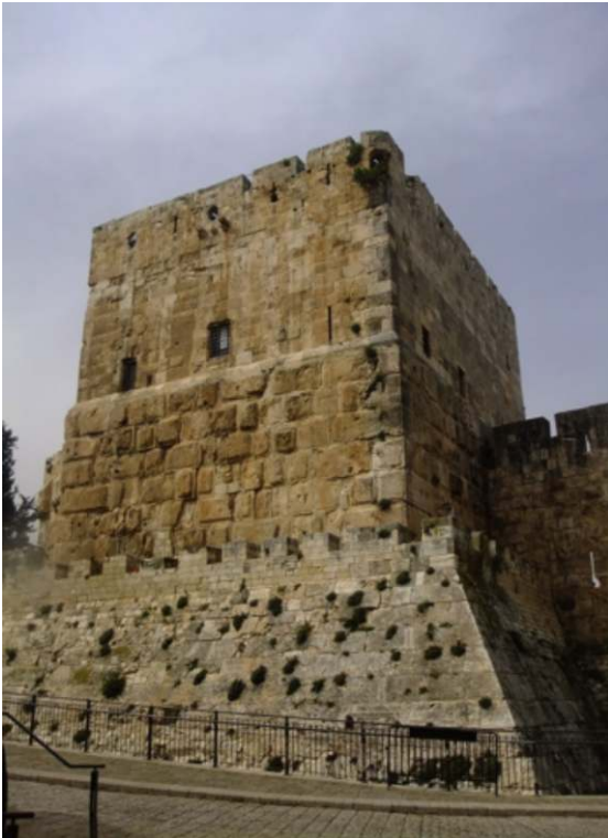
La Tour de David aujourd'hui, vue de l'intérieur, vers l'est