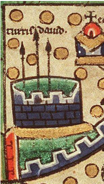
La Tour de David, plan de Jérusalem, détail (The Hague KB 76 F 5 fol. 1R [c. 1200])