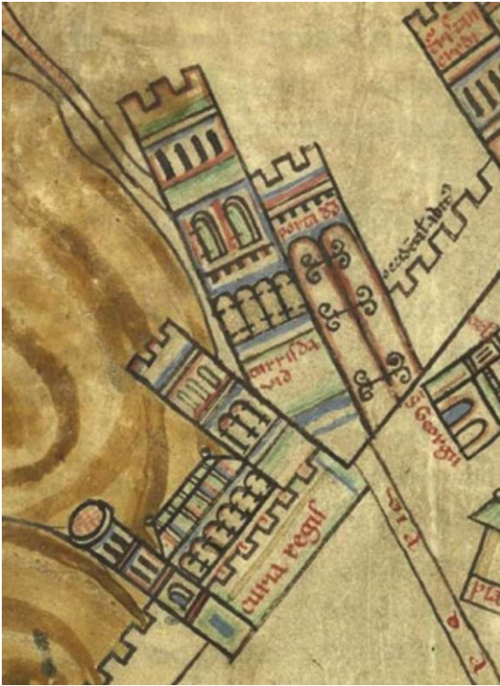
La Tour de David et la curia regis , plan de Jérusalem, détail (Cambrai BM. ms. 437 [c. 1170])